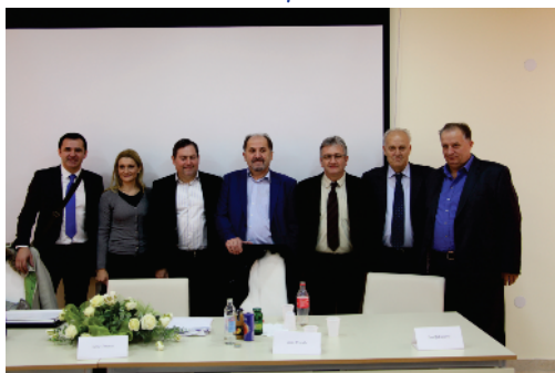
Članovi Komisije sa menadžmentom Univerziteta