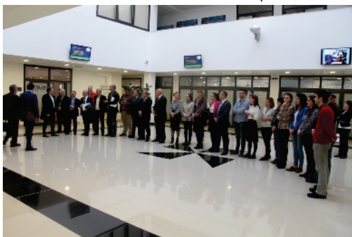
Posjeta Komisije Fakultetu za menadžment i poslovnu ekonomiju