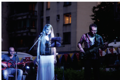
Koncert Univerzitetskog benda