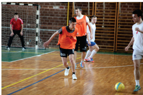
Studentske sportske igre

Pored obrazovnog procesa, Univerzitet uspostavlja saradnju sa javnim ustanovama i institucijama, privrednim subjektima, lokalnim zajednicama, društvenim, kulturnim i sportskim udruženjima i slično. Upravo savremeni obrazovni sadržaji i studijski programi koji se izučavaju na Fakultetima i ispunjavaju zahtjeve Bolonjskog procesa, osnovni su razlozi ukazanog povjerenja od strane velikog broja studenata.