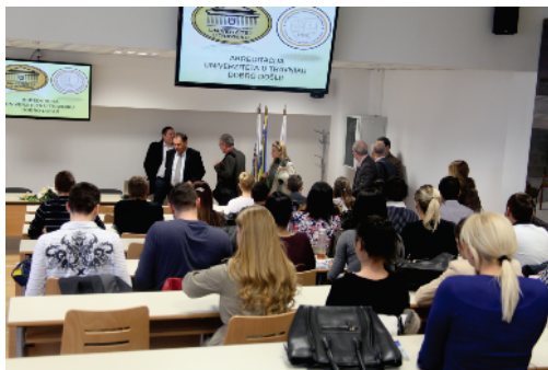
Posjeta Komisije Pravnom fakultetu