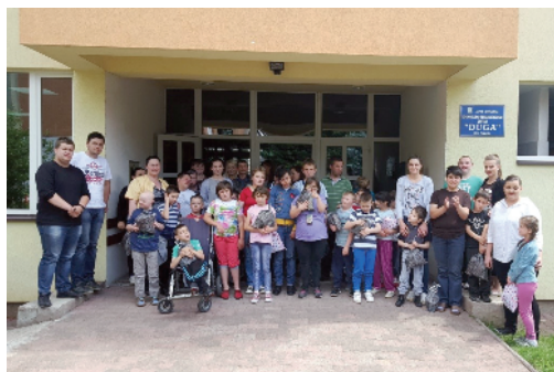
Humanitarni projekti studenata