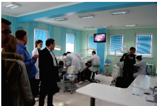
Posjeta komisije Farmaceutsko zdravstvenom fakultetu

Preporuka Komisije za akreditaciju Univerziteta je potvrdila rezultate samoevaluacije i prisutan trend porasta upisa studenata na Univerzitet u Travniku, što jasno pokazuje da je Univerzitet u Travniku postao prepoznatljiva ustanova visokog obrazovanja koja se etablira u akademskoj zajednici Bosne i Hercegovine.