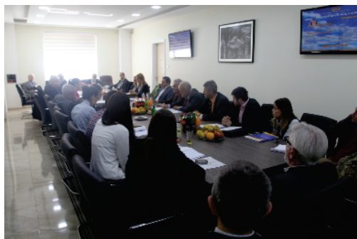
Posjeta Komisije Fakultetu za tehničke studije