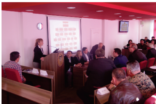
Posjeta komisije Edukacijskom fakultetu

Shodno propisanim procedurama, Univerzitet u Travniku je okončao postupak eksterne evaluacije. Komisija domaćih i međunarodnih stručnjaka za ocjenjivanje i reviziju kvalitete davanja preporuka o akreditaciji Univerziteta u Travniku, utvrdila je da isti ispunjava uvjete za punu akreditaciju i, shodno tome, dala je mišljenje i preporuku za njegovu akreditaciju.