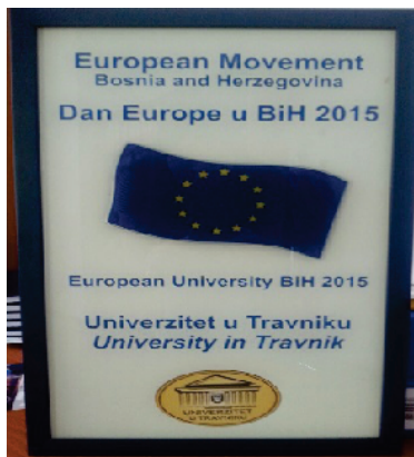
Univerzitet u Travniku je dobitnik prestižnog priznanja i Plakete za najbolji univerzitet u Bosni i Hercegovini